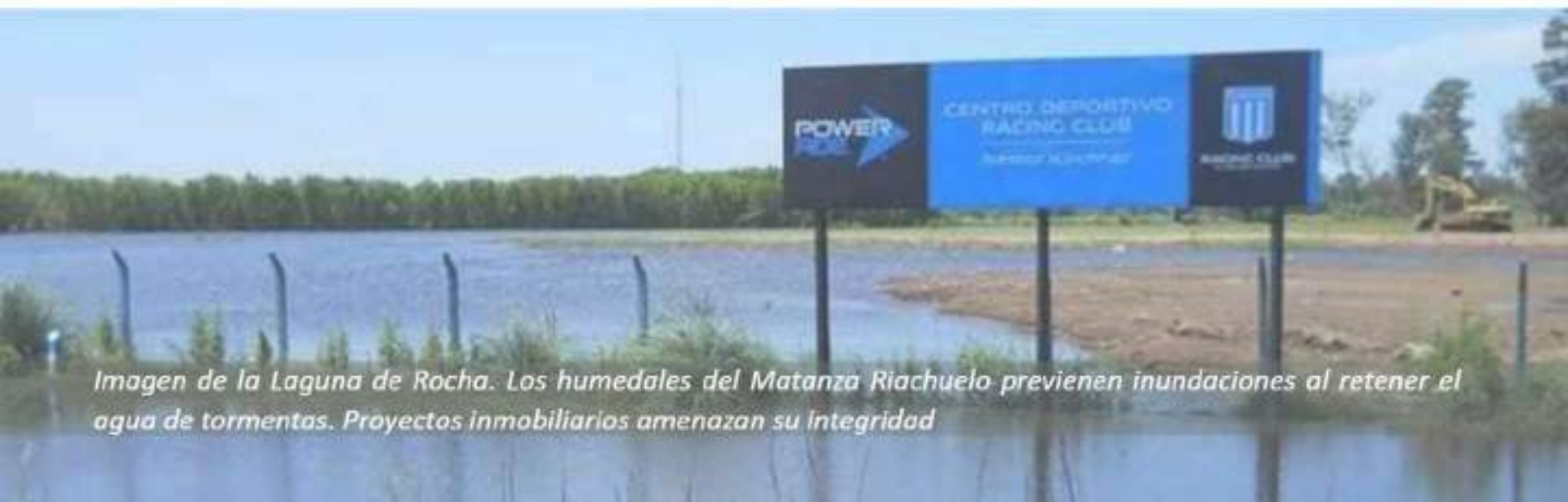
Imagen de la Laguna de Rocha. Los humedales del Matanza Riachuelo previenen inundaciones al retener el agua de tormentas. Proyectos inmobiliarios amenazan su integridad

Regulan las fuentes de agua, amortizan inundaciones y períodos de sequía, recargan los acuíferos, abastecen y depuran las aguas, evitan la erosión de las costas, garantizan el hábitat y alimento a numerosas especies, retienen y exportan nutrientes y sedimentos. Hacen posible un abanico de actividades humanas, como la pesca, la agricultura, el turismo, son ecosistemas de gran importancia cultural y educativa. Los humedales son sinónimo de vida.